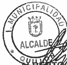
ALBERTO RAÚL GYHRA SOTO ALCALDE